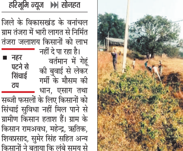
साफ-सफाई करते किसान।

हरिभूमि न्यूज | सोनहत जिले के विकासखंड के वनांचल ग्राम तंजरा में भारी लागत से निर्मित तंजरा जलाशय किसानों को लाभ नहीं दे पा रहा है।