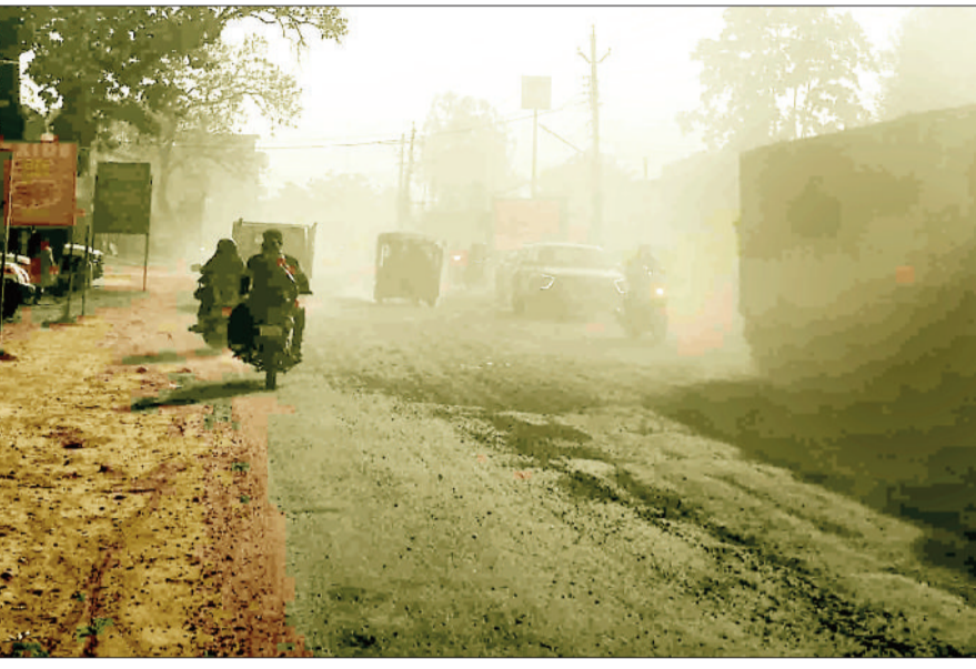
एनएच पर उड़ती धूल।

बता दें कि शहर के बीच से होकर गुजरने वाली मुख्य सड़क एनएच के अधीन है। शहर के एमजी रोड से लेकर गांधी चौक, घड़ी चौक, देवीगंज रोड, संगम चौक, महामाया चौक से सदर रोड, अग्रसन चौक, होते हुए दरिमा रोड तक की सड़क एनएच 43 के अधीन आती है और इस सड़क की स्थिति बेहद ही जर्जर हो चुकी है। शहर के मुख्य व्यावसायिक मार्ग की सड़क के जर्जर होने से लोगों को खासी परेशानियों का सामना करना पड़ रहा है। सड़क पर बने गड्डों के कारण बारिश के समय