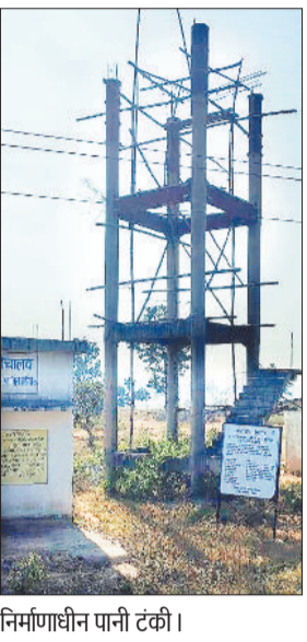
निर्माणधीन पानी टंकी।

हरिभूमि न्यूज | बैकुंठपुर जिले में गांव-गांव में लोगों के घरों तक पानी पहुंचाने की जल जीवन मिशन योजना का हाल बेहाल है। इस योजना के तहत जिले के विभिन्न पंचायतों में करोड़ों रूपए फूंक दिए गए, लेकिन लोगों के हलक शूखे हैं। कोरिया जिले के पंचायतों का आधा-अधूरा कार्य जल जीवन मिशन का पड़ा हुआ है।